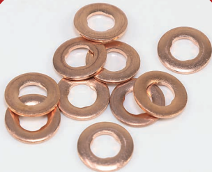
Wärmeschutzscheiben (Flamm- / Dichtscheiben)

Unser Zubehörprogramm umfasst u.a. Hochtemperatur Keramikpaste (Made in Germany) für Dieselinjektoren und Glühkerzen, Wärmeschutzscheiben-Sets, Schrauben für Einspritzdüsenhalter sowie Dichtungssätzen. Teilweise in OE-Ausführung.